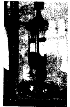
NETKO MILO I MA BUDNA

•• Osim lokacija koje su gradski urbanisti predvidjeli u GUP-u za izgradnju novih garaža, zainteresirani građani mogu Gradu predložiti i alternativna rješenja. Primjerice, svaka zgrada, ako postoji pogodna lokacija, može zatražiti da joj se izgradi garaža ili otvoreno parkiralište.